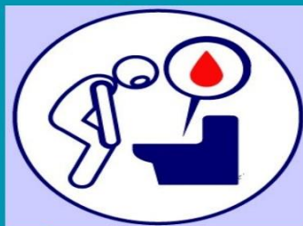
وجود خون در مدفوع