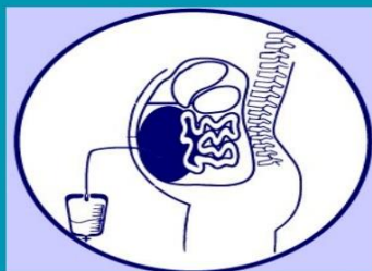
آسیت (تجمع مایع در فضای شکمی)